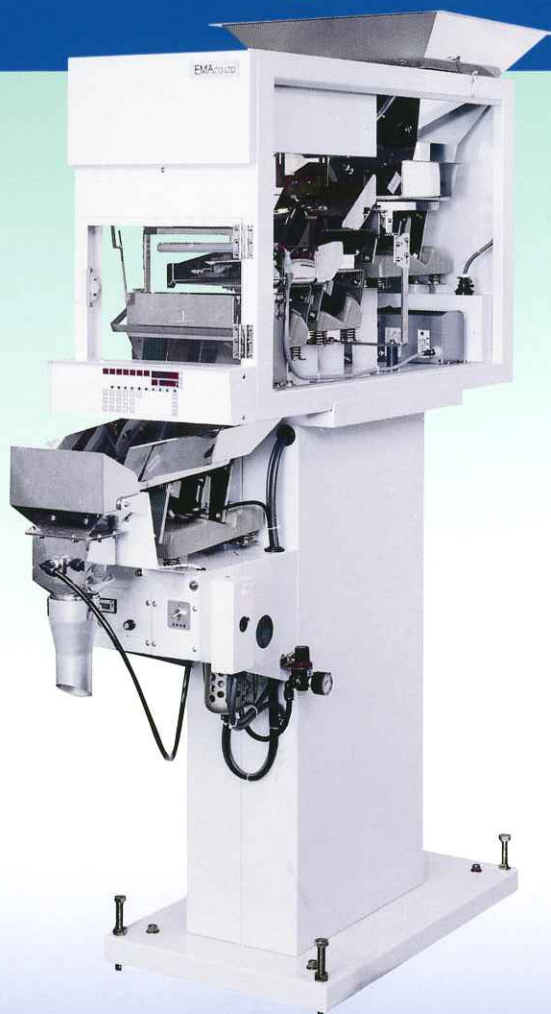
(写真は P-3YG 型開袋装置付)